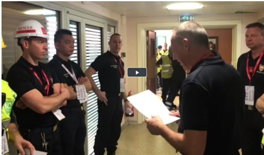
MRMI Monaco, 2019

Cette formation utilise l'outil de simulation MACSIM ® qui est basé sur des magnets positionnables sur des tableaux blancs. Plus de 600 fiches de victimes (créées à partir de dossiers de patients réels) sont disponibles pour les exercices de simulation. La totalité de la chaîne des secours et des soins médicaux (depuis le chantier jusqu'aux services d'hospitalisation post-opératoire et aux services de soins intensifs) ainsi que la totalité de la chaîne de commandement avec les articulations interservices sont testées. Des exercices courts, limités à un ou deux segments de la chaîne sont également possibles.